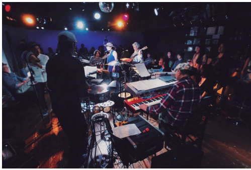
SARAVAH 도쿄에서 360도 원형 스테이지 라이브