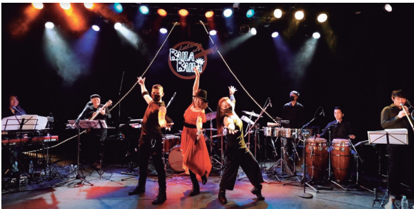
DDD 아오야마 크로스 시어터에서 에어로빅. 라틴.스트리트 댄스 프레젠테이션과의 콜라보 라이브