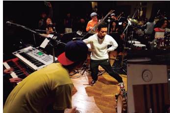
아프로쿠반 댄서 아크로요가와와의 콜라보레이션