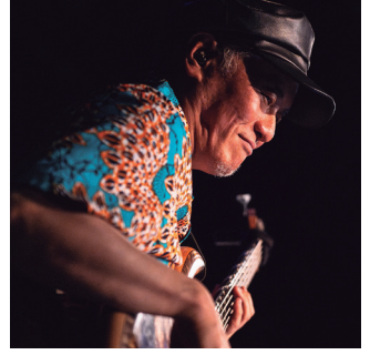
코이즈미 테츠오 Tetsuo Koizumi

오르케스타 데 라 루스의 전 멤버이자, 라틴 음악을 누구보다 잘 아는 일본의 피아니스트 겸 음악 프로듀서. 쿠바, 프랑스 등 해외 공연도 소화한다. 아프로 어바니티에서는 스페셜 서포트 멤버로 참전.