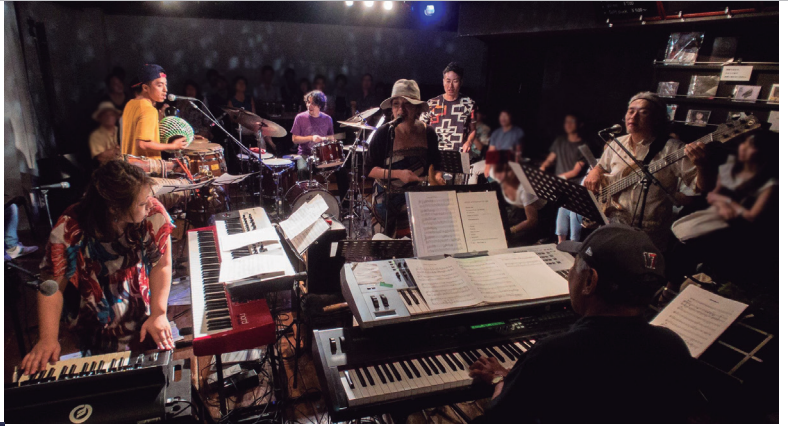
SARAVAH 도쿄에서 360도 원형 스테이지 라이브