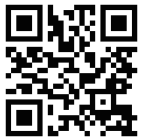
◆시어터 라이브 2021 | 다이제스트 영상