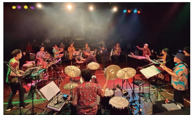
DDD 아오야마 크로스 시어터에서 유관중 시어터 라이브 2021