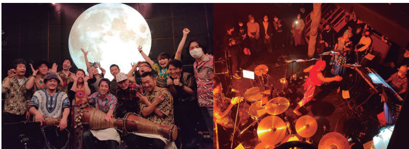
츠키미루키미오모우에서 "ROOTS OF AFRO URBANITY"